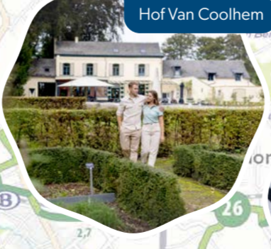
Hof Van Coolhem