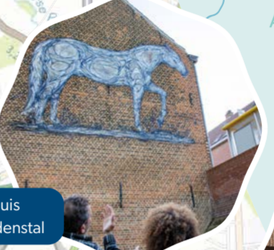
Natuurhuis De Paardenstal