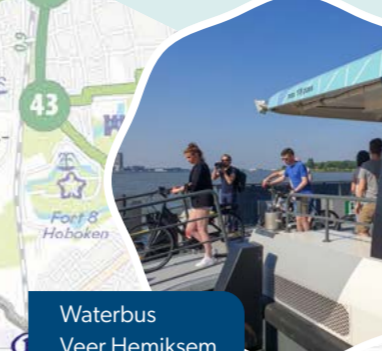
Waterbus Veer Hemiksem