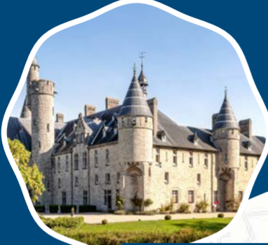
Kasteel Marix de Sainte Aldegonde