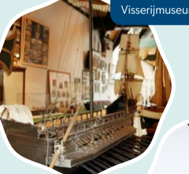
Scheepvaart- en Visserijmuseum