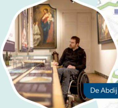
De Abdij van Bornem