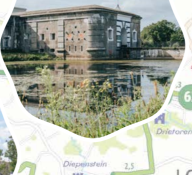
Museum en Park Fort Liezele