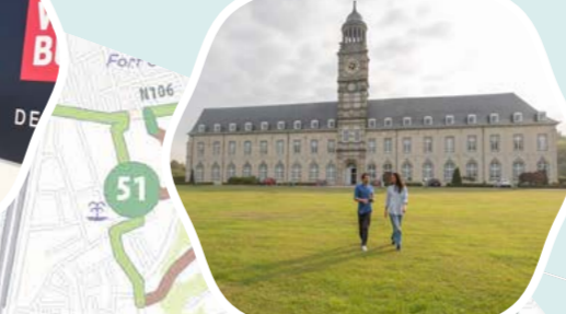
Abdij van Hemiksem/ Gilliot & Roelants Tegelmuseum