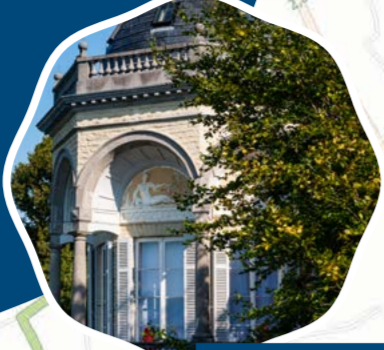
Paviljoen De Notelaer