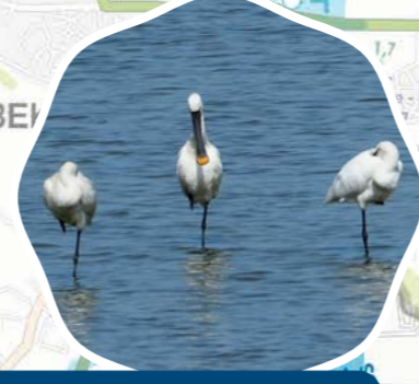
Zeevluis Wintam - Noordelijk Eiland