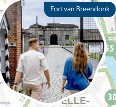
Fort van Breendonk